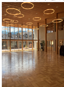
多目的広場(磨き丸太)