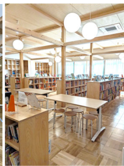
メディアセンター(図書室)