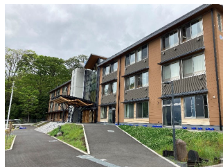
①松田町立松田小学校(外観)