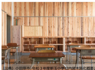
②小田原市立新玉小学校(内観)